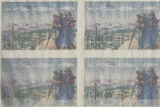
Fürsorge-Fonds Fl. Beob. Gr. 4